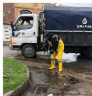
Av. Maldonado y Espoch