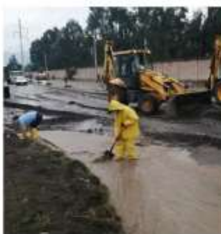
Av. Monseñor Leonidas Proaño