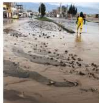
Hondurada T1 de Noviembre entre Canónigo Ramos y Mltón Reyes