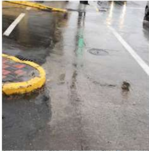
Después de la Intervención en la Av. Edelberto Bonilla y Avda. 21 de abril (Complejo de la Panadería)