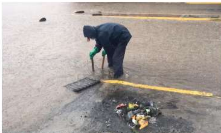
Intervención en la Av. Edelberto Bonilla y Avda. 21 de abril (Complejo de la Panadena)

La Empresa Pública Municipal de Agua Potable (EP-Emapar), activa inmediatamente sus equipos de emergencia, ante la fuerte lluvia de la tarde de ayer, los mismos que se desplegaron a los puntos críticos identificados en estas situaciones.