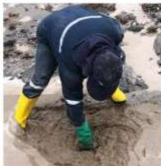
Av. Monseñor Leonidas Proaño