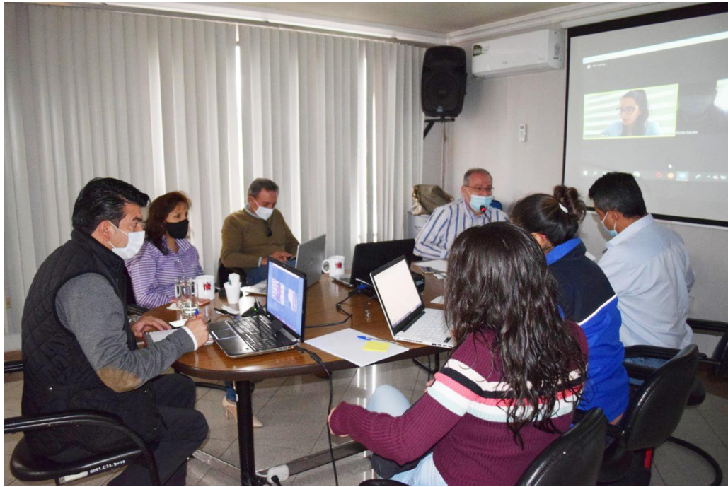
Reunión técnico financiera