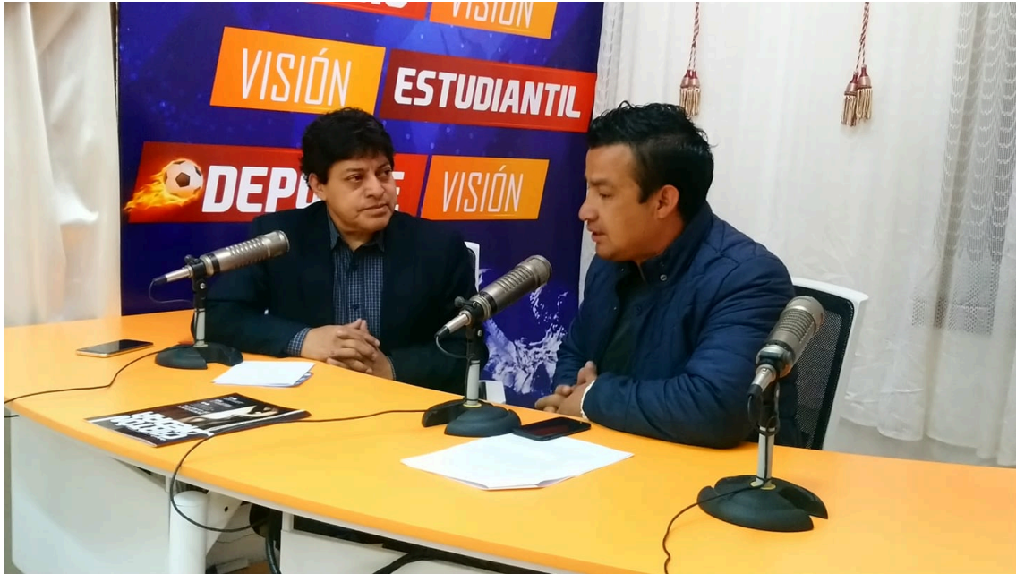
- Radio Bonita