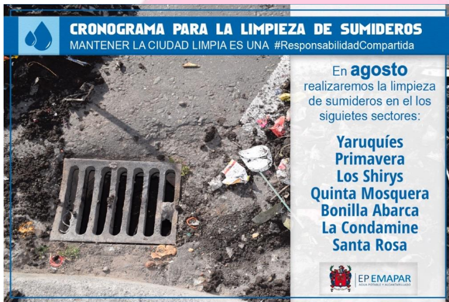
Cronograma de barrios que serán intervenidos durante el mes de agosto.

De esta manera la EP Emapar trabaja en beneficio de la ciudadanía para garantizar un sistema de alcantarillado de calidad y evitar posibles inundaciones en época de lluvia, la acción preventiva nos permitirá estar siempre preparados.